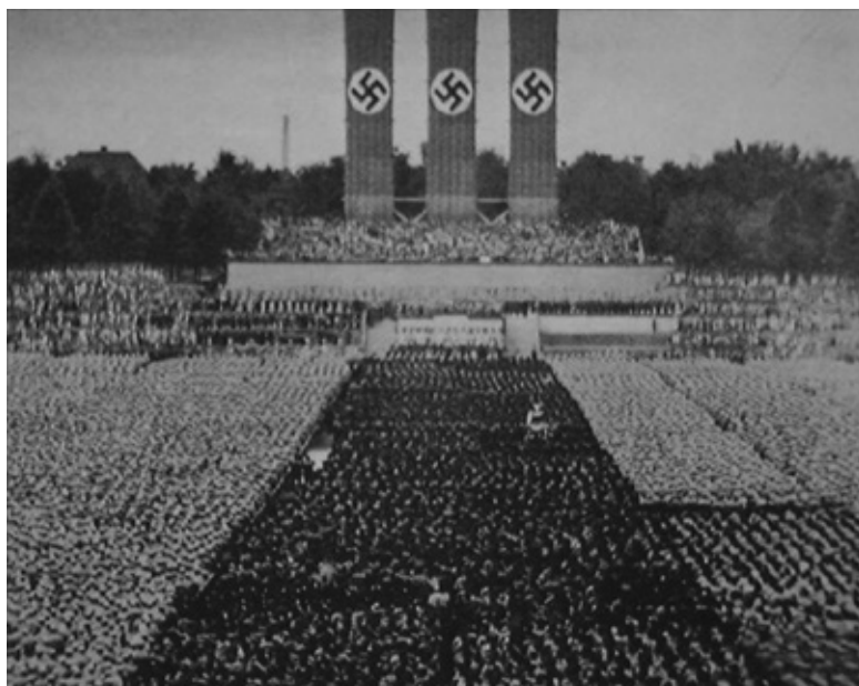
FIGURA 12 – CENA DO FILME “O TRIUNFO DA VONTADE” ( TRIUMPH DES WILLENS – 1934), DA CINEASTA PREFERIDA DE HITLER, LENI RIEFENSTAHL. O FILME DOCUMENTA O CONGRESSO NAZISTA DE 1934