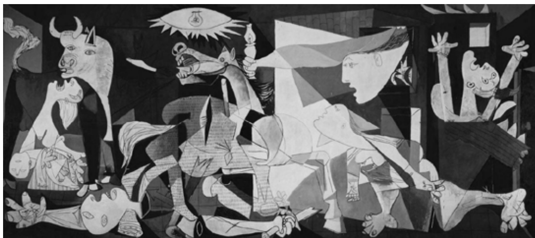
FIGURA 13 – “GUERNICA” (1937), ÓLEO SOBRE TELA DO PINTOR ESPANHOL PABLO PICASSO (1881-1973)

FONTE: Disponível em: < http://upload.wikimedia.org/wikipedia/en/7/74/PicassoGuernica.jpg >. Acesso em: 15 nov. 2008.