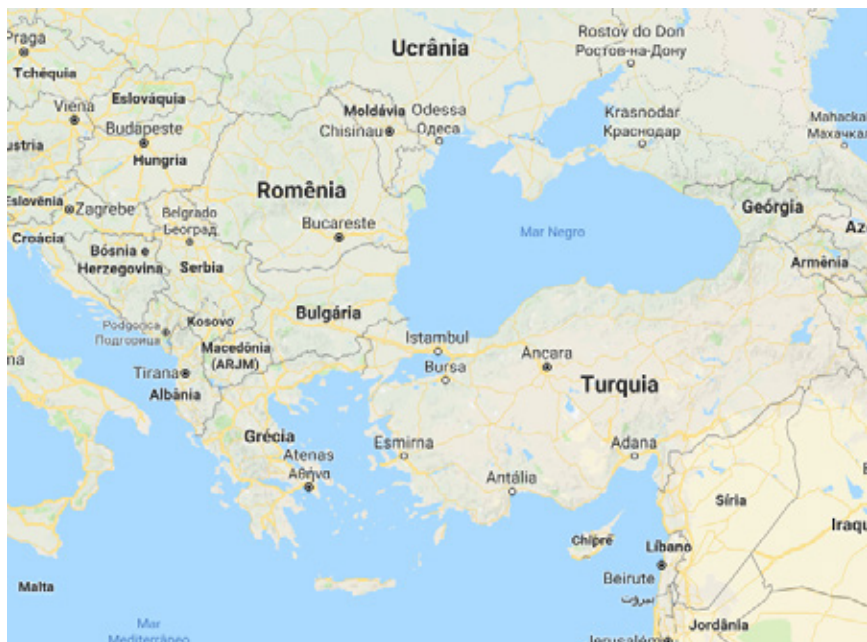
FIGURA 3 – MAPA DOS BÂLCÃS: O PALCO INICIAL DA PRIMEIRA GUERRA MUNDIAL