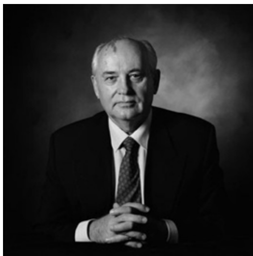
FIGURA 20 – MIKHAIL GORBACHEV