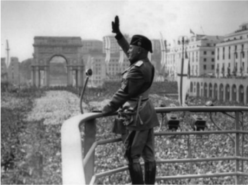
FIGURA 10 – MUSSOLINI FAZ A SAUDAÇÃO ROMANA DIANTE DE UMA MULTIDÃO EM ROMA