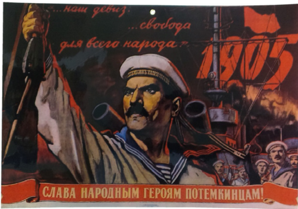
FIGURA 6 – “GLÓRIA AOS HERÓIS DO POVO DO ENCOURAÇO POTEMKIN” (PÔSTER DO FILME ENCOURAÇO POTEMKIN)