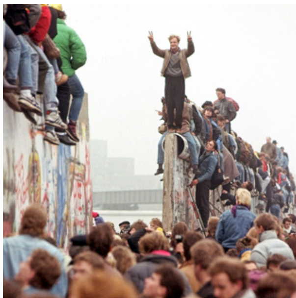
FIGURA 19 – MURO DE BERLIM TOMADO