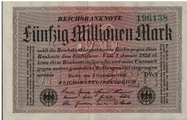
FIGURA 11 – NOTA ALEMÃ DE 1º DE SETEMBRO DE 1923, NO VALOR DE 50 MILHÕES DE MARCOS. EXATOS DOIS MESES APÓS ESSA DATA, SERIAM NECESSÁRIAS 720 NOTAS COMO ESSA PARA COMPRAR MEIO QUILO DE CARNE