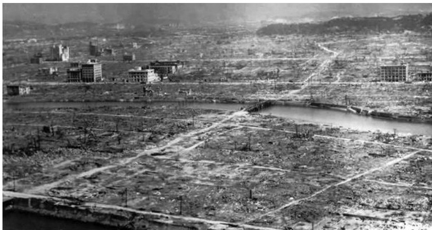
FIGURA 15 – A CIDADE DE HIROSHIMA APÓS O LANÇAMENTO DA BOMBA ATÔMICA, EM 6 DE AGOSTO DE 1945