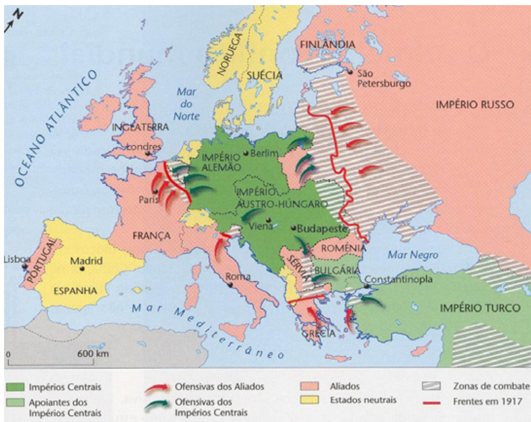
FIGURA 4 – A GUERRA E AS OPERAÇÕES MILITARES