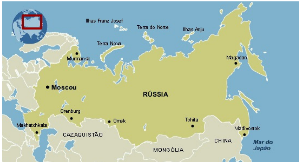
FIGURA 5 – MAPA DO IMPÉRIO RUSSO