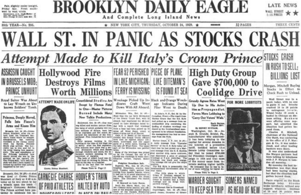
FIGURA 9 – MANCHETE DE 1929: "WALL STREET EM PÂNICO COM A QUEDA DA BOLSA"