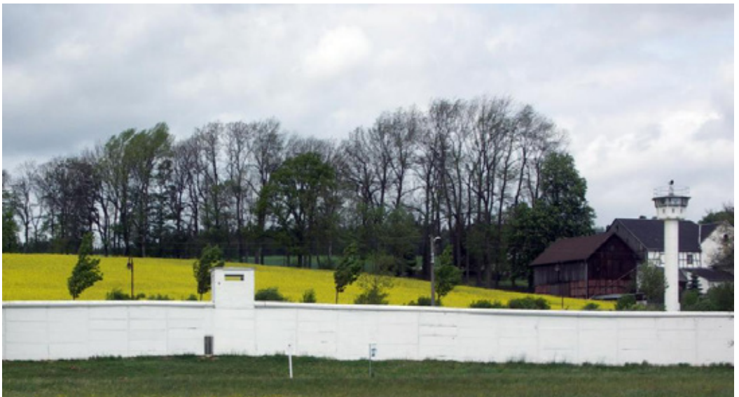
FIGURA 17 – PARTE PRESERVADA DO MURO QUE DIVIDIA AO MEIO O VILAREJO DE MÖDLAREUTH, NA FRONTEIRA ENTRE ALEMANHA OCIDENTAL E ALEMANHA ORIENTAL. A CIDADE FOI CHAMADA PELOS NORTE-AMERICANOS DE “PEQUENA BERLIM”