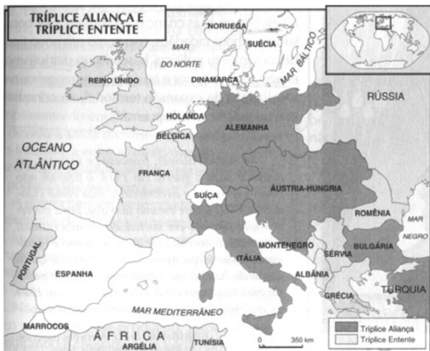
FIGURA 2 – OS BLOCOS DE PODER NA PRIMEIRA GUERRA MUNDIAL

FONTE: VIDAL-NAQUET, P. et al. Atlas Histórico . Lisboa: Círculo do Leitor.