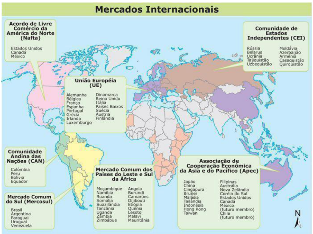
FIGURA 21 – CONFIGURAÇÃO DE BLOCOS ECONÔMICOS REGIONAIS

FONTE: Disponível em: < https://www.todoestudo.com.br/geografia/apec >. Acesso em: 31 out. 2018.