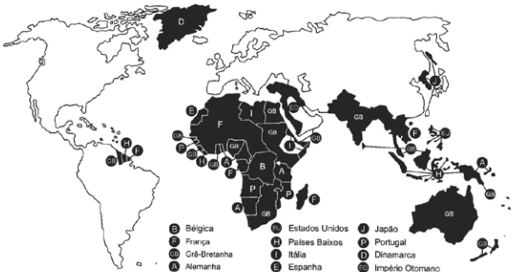
FIGURA 1 – OS IMPÉRIOS COLONIAIS NO MUNDO EXTRAEUROPEU EM 1914