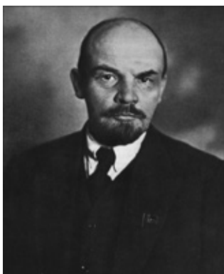
FIGURA 7 – FOTOGRAFIA DE VLADIMIR ILITCH ULIÂNNOV (LÊNIN)