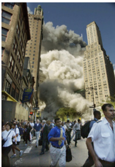
FIGURA 22 – FUGA APÓS O ATENTADO TERRORISTA EM NOVA IORQUE