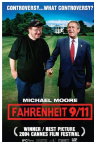
FIGURA 23 – CAPA DO DOCUMENTÁRIO FAHRENHEIT 9/11