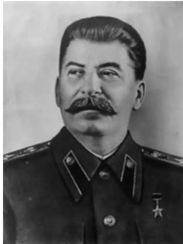
FIGURA 8 – RETRATO DE JOSEF STALIN