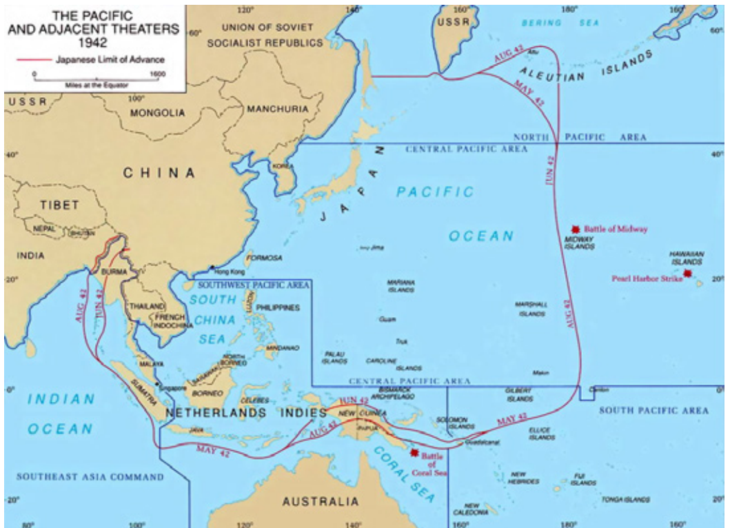
FIGURA 14 – A MÁXIMA EXPANSÃO JAPONESA DURANTE A GUERRA, 1942